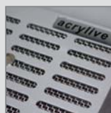
Eloxiertes Lüftungsgitter aus Aluminium