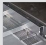
Längstraversen aus see- wasserfestem Aluprofil